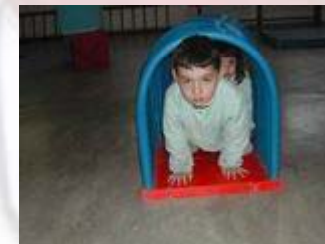
Aula de psicomotricitat