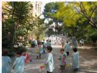
Setmana Solidària i Pasqua