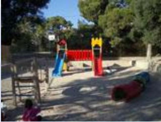
Un parc infantil per al seu ús exclusiu